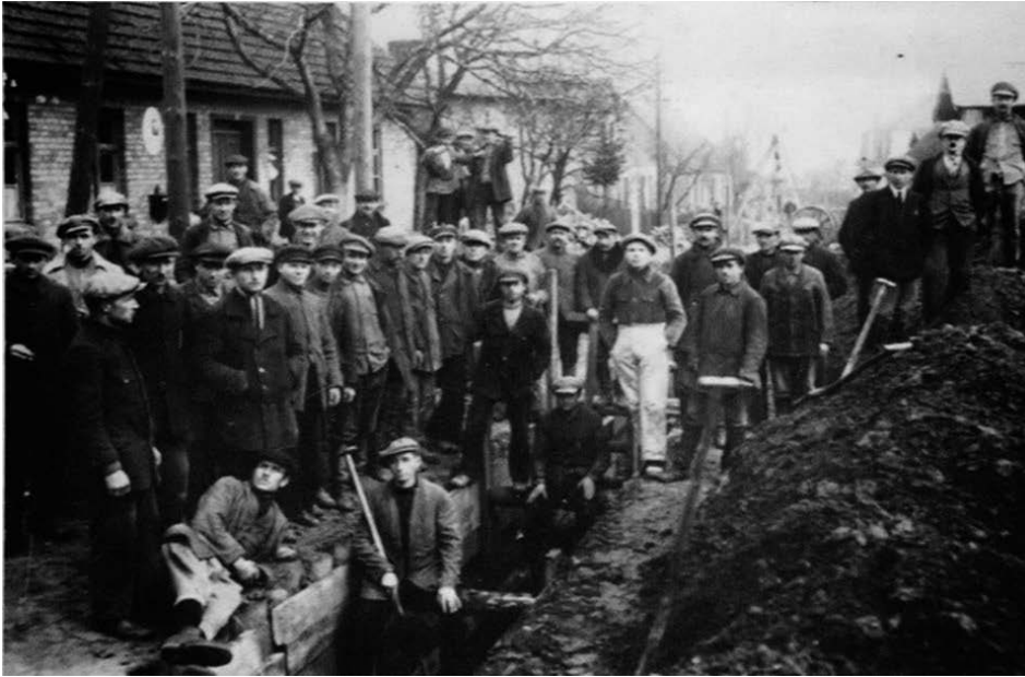
Rys. 4. Brygada robotników podczas układania rurociągu na Oksywiu