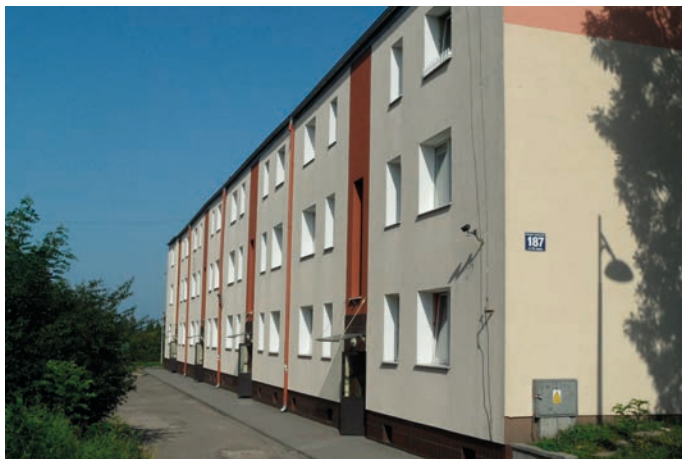
Rys. 2. Budynek mieszkalny na osiedlu „Paged” w 2018 roku

Tempo prac budowlanych na osiedlu „Paged” było imponujące, ponieważ do lutego 1936 roku ukończono 5 bloków mieszkalnych z 176 lokalami. W kolejnym sezonie budowlanym wykonano dalsze dwa bloki (B3 i B4), a następnie inwestycję przerwano z nieustalonych powodów. Dodać należy, że ponad osiemdziesięcioletnie budynki na osiedlu „Paged” (podwyższone o jedno piętro) nadal pełnią swą funkcję mieszkaniową (rys. 2).