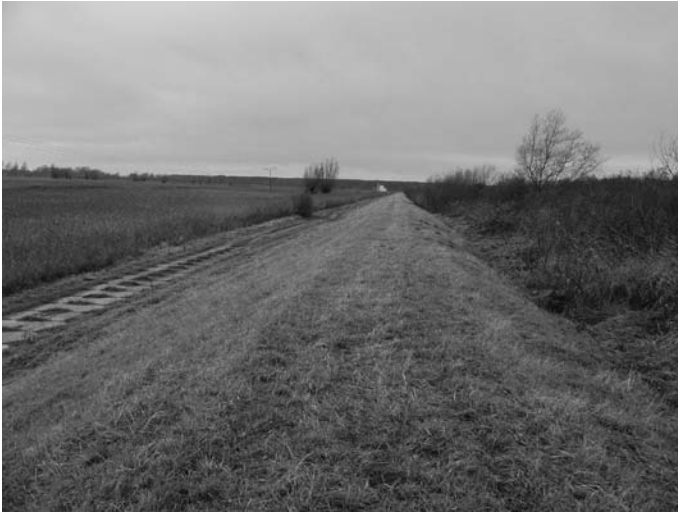
Rys. 1. Widok nasypu na polderze 76 w miejscowości Nowe Dolno zmodernizowanego z zastosowaniem metody zagęszczania udarowego po 13 latach eksploatacji budowli

W drugim etapie, po rozbudowaniu i podwyższeniu nasypu wybito kinetę w nadbudowanej części metodą udarową, wykonując rdzeń szczelny, którego oś pokrywała się z osią rdzenia w starym nasypie.