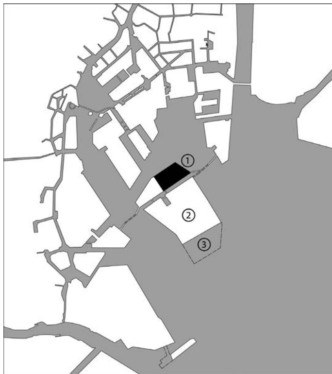
Rys. 1. Zatoka Tokijska z ukazaniem sztucznie tworzonych wysp. Zaznaczony teren to Sea Forest Island – (1) powstały z wysypiska odpadów Inner Central Breakwater; (2) – aktualnie użytkowane wysypisko New Sea Surface Deposit; (3) – kolejne planowane rozszerzenie terenów wysypiskowych. Opracowanie własne według [4]

Szacuje się, że obecnie około 0,5% powierzchni Japonii to ląd uzyskany przez zasypywanie akwenów wodnych [5]. Wydaje się to mało w ujęciu procentowym, jednak oznacza, że w odniesieniu do całkowitej powierzchni kraju pozyskano obszar 17 tys. km 2 . Dla porównania powierzchnia Słowenii zajmuje około 20 tys. km 2 . Pierwsze operacje związane z pozyskiwaniem dodatkowej powierzchni lądów z terenów wodnych przeprowadzano w Japonii już w XII wieku. Zasadniczy wzrost aktywności w tym zakresie nastąpił po drugiej wojnie światowej, a współcześnie są budowane w ten sposób między innymi spektakularne lotniska. W Zatoce Tokijskiej przykładem takich działań są również świadomie tworzone od dziesięcioleci wysypiska odpadów, które mają w przyszłości pełnić rolę nowych części miasta (rys. 1). Składowiska te są budowane z wykorzystaniem offshorowych technologii inżynierskich opracowanych na potrzeby budowy zabezpieczeń brzegowych.